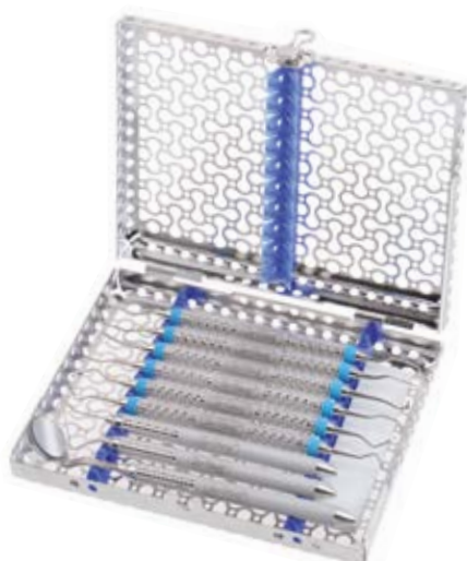
IME12DIN1 – кассета для стерилизации и хранения 10-ти инструментов